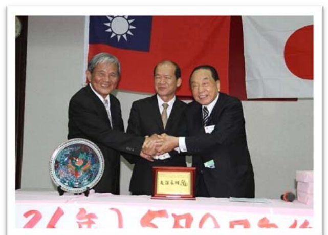
友誼永固金牌(999純金5錢)(三片式紅木盒，尺寸14*19cm，外框20*25cm)