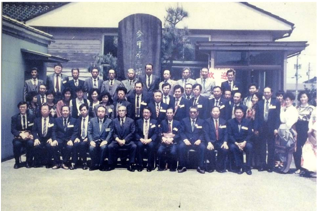
1992.5.10-15 台灣省嘉南農田水利會組團訪問日本國石川縣河原市用水土地改良區