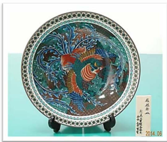
九谷燒 - 「鳳凰飾皿」(尺寸φ32cm)