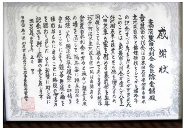
2000.5.4 台灣省嘉南農田水利會與日本國石川縣河原市用水土地改良區交流10年紀念