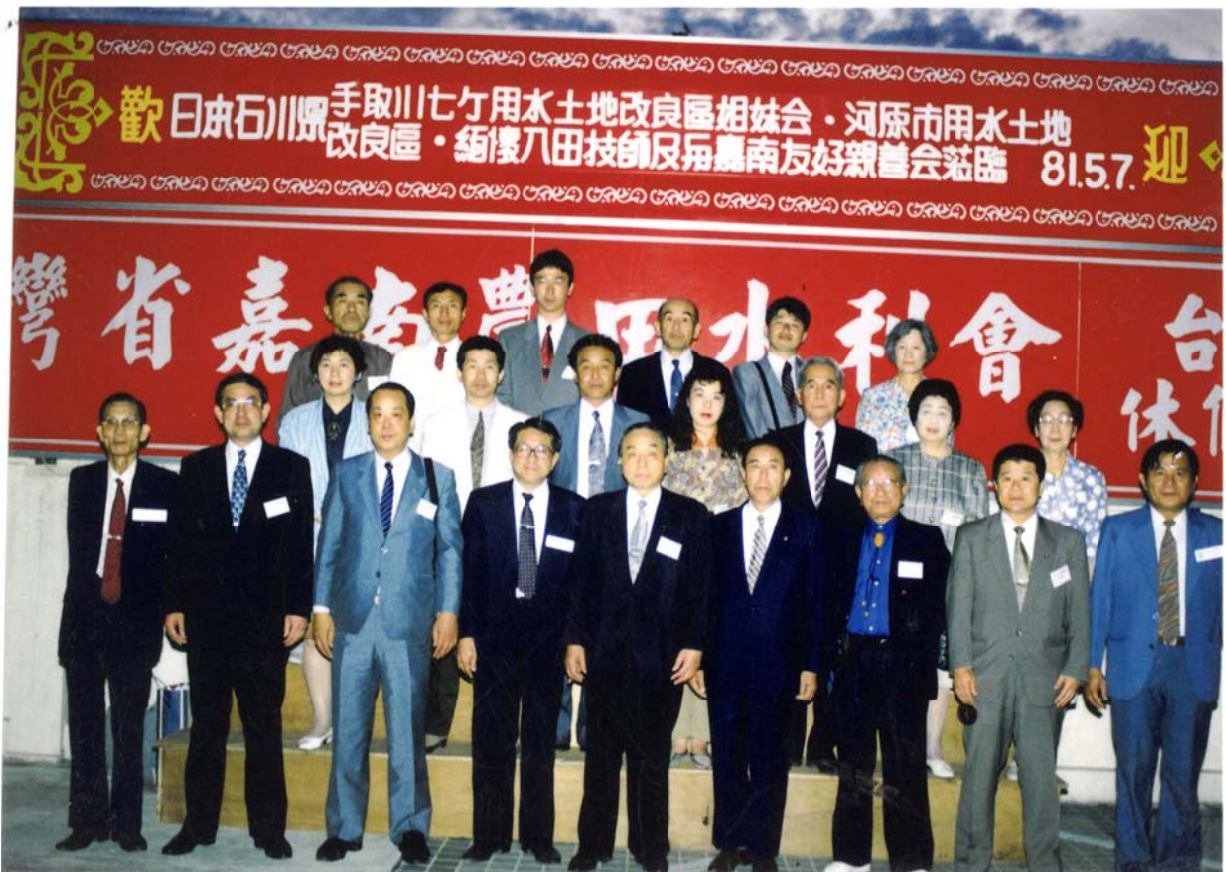
1992.5.7 日本「手取川七個用水土地改良區姐妹會、河原市用水土地改良區、緬懷八田技師及與嘉南友好親善會」訪問嘉南農田水利會